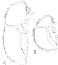
Fig. III. X. hagedorni. A) fema, vista de perfil. B) macho, visto de perfil. [Orig.]

O dimorphismo é muito commum nesta familia, principalmente no genero Xyleborus com o qual temos travado conhecimento mais de perto. As vezes os machos são menores do que as femeas, mas conservam as mesmas formas; outras vezes, como é o caso para a Xyleborus hagedorni , Igl. (Fig. III), o macho é menor e é quasi sime-espherico.