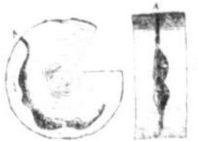
Fig. II. A) corte transversal de uma arvore, mostrando a galeria do X. theringi-Igl. A) entrada do insecto adulto. A mesma galeria, vista de perfil; (B) a camera onde se encontra a prole. [Orig.]

Os ipidios penetram na madeira fazendo um buraco cujo diametro dá justamente para a passagem do insecto. As galerias são construidas de um modo especial, não se podendo confundir galerias de especies diversas. Assim é que em se tendo conhecimentos praticos das diferentes especies e das suas respectivas galerias, pode-se determinar aquellas pelo exame somente destas: cada especie faz as suas habitações ou galerias «à sa façon». (Fig. 2).